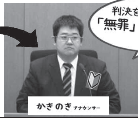
かきのぎアナウンサー